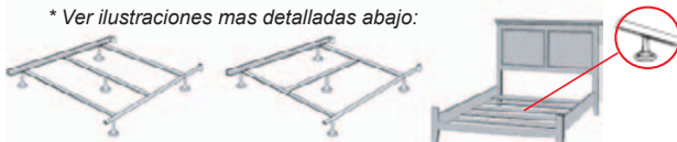
Una base Queen / King con un soporte en medio. Una base Queen / King con dos soportes en medio. Una base de madera debe tener cinco soportes mínimo, como incluyendo un soporte en el centro.

* Ver ilustraciones mas detalladas abajo: